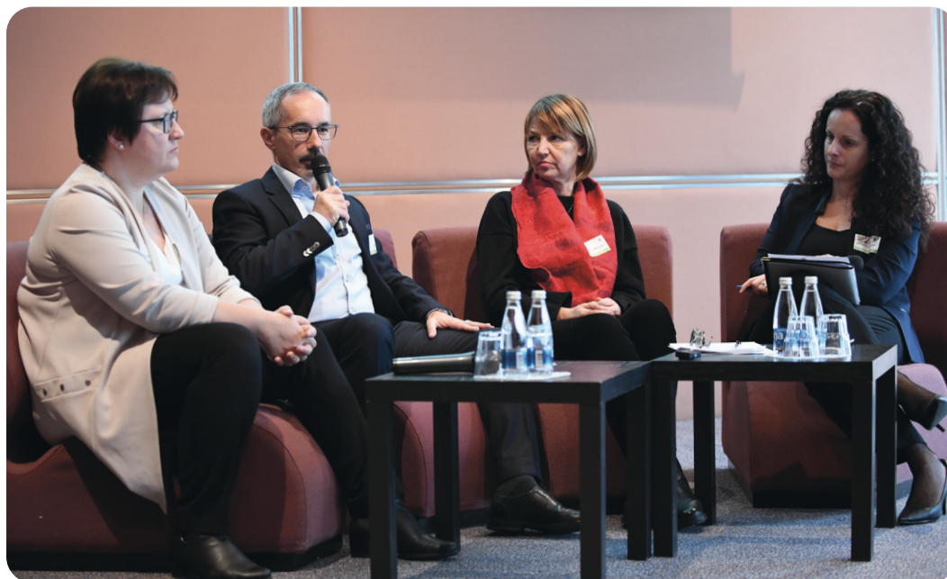
Prehranski forum »Živilska industrija miga - migaj z nami tudi ti!«, Ljubljana, december 2019

Zaveze odgovornosti so pomemben odraz sodelovanja med živilskopredelovalno industrijo, vladnimi in nevladnimi organizacijami ter drugimi deležniki s področja prehrane. Implementacijo aktivnosti vseh sektorjev, podpisnikov zavez odgovornosti spremlja Odbor za spremljanje, usmerjanje razvoja in informiranje o živilih izboljšane sestave (leta 2016 ustanovljen kot Odbor za spremljanje implementacije zavez odgovornosti). Odbor sestavljajo predstavniki Ministrstva za kmetijstvo, gozdarstvo in prehrano, Ministrstva za zdravje, Ministrstva za izobraževanje, znanost in šport, Uprave za varno hrano, veterinarstvo in varstvo rastlin, Nacionalnega inštituta za javno zdravje ter GZS-Zbornice kmetijskih in živilskih podjetij.